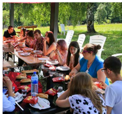
Chantier jeunes solidaires 2016

Plus d'infos sur l'université d'été sur le site ou la page www.facebook.com/groups/YoungCaritas/