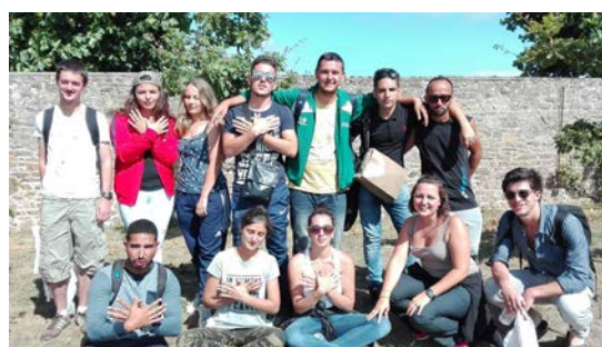
Université d'été à Saint Malo - 2016