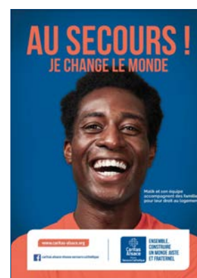
Les 3 visuels de la campagne bénévolat