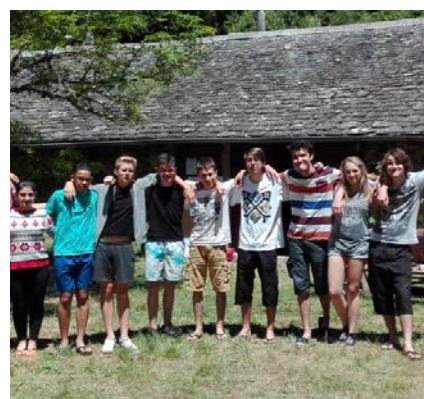
Camp à Plembel - été 2016